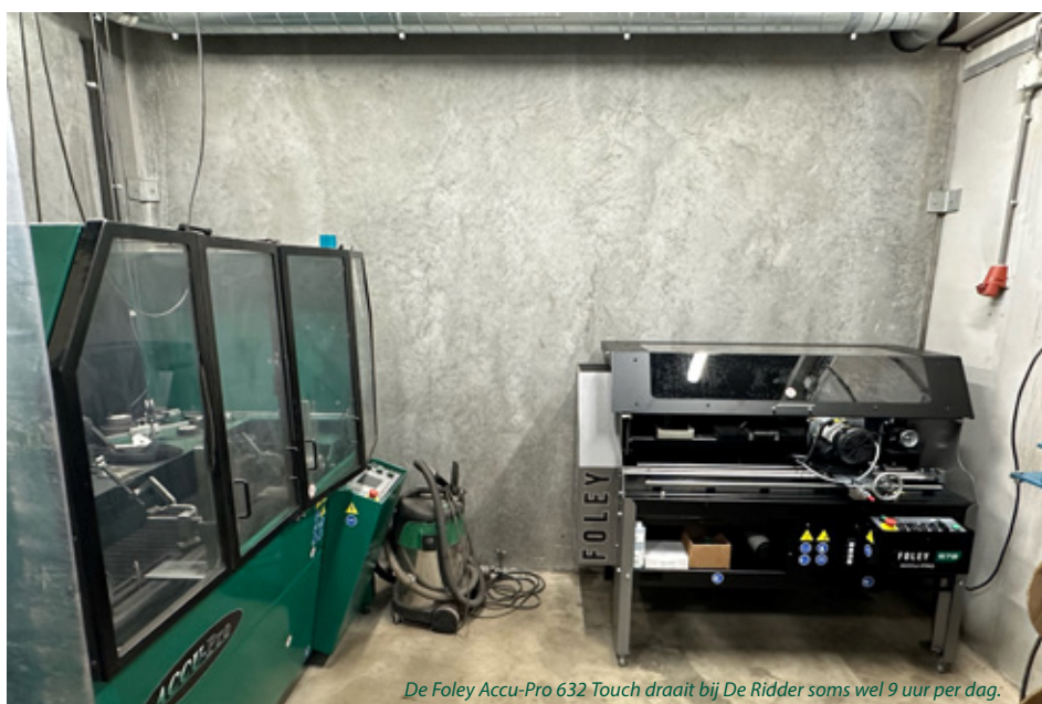
De Foley Accu-Pro 632 Touch draait bij De Ridder soms wel 9 uur per dag.