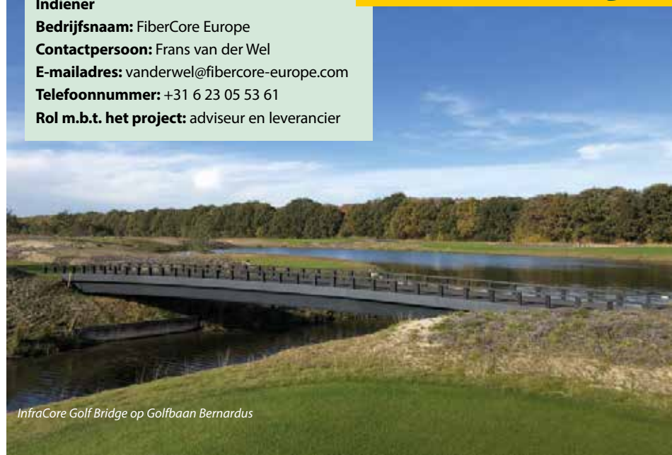
InfraCore Golf Bridge op Golfbaan Bernardus

In opdracht van Golfbaan Bernardus produceerde FiberCore Europe 17 InfraCore Golf Bridges met verschillende lengtes, variërend van 7,80 tot 23 meter vrije overspanning. Deze slanke, onderhoudsarme bruggen sluiten perfect aan op het state of the art ontwerp van de golfbaan en de faciliteiten. InfraCore Golf Bridges zijn een uitkomst voor iedere greenkeeper; na installatie heeft hij er geen omkijken meer naar. De prefab composiet bruggen vergen nauwelijks onderhoud en gaan meer dan 100 jaar mee. De bruggen zijn antislip en bestand tegen roest en rotting. De bruggen worden gebouwd in de FiberCore-fabriek in Rotterdam en prefab afgeleverd op de bouwlocatie. Door het lage gewicht is voor de installatie van de brug slechts licht materiaal nodig. Zo blijft de schade aan de baan tot een minimum beperkt.