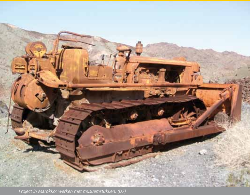
Project in Marokko: werken met museumstukken. (D7)