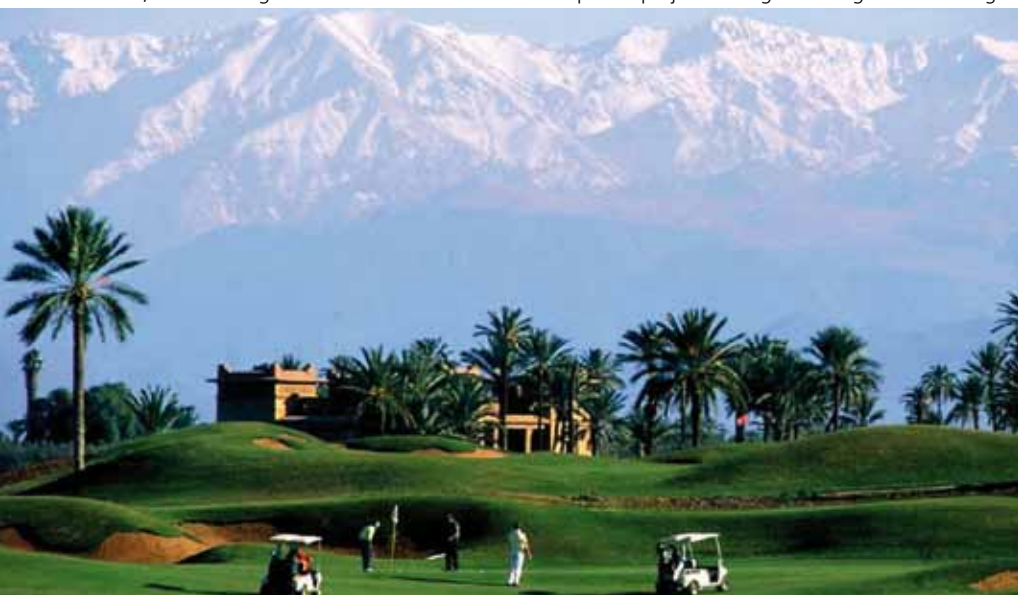
Royal golfclub Marokko.