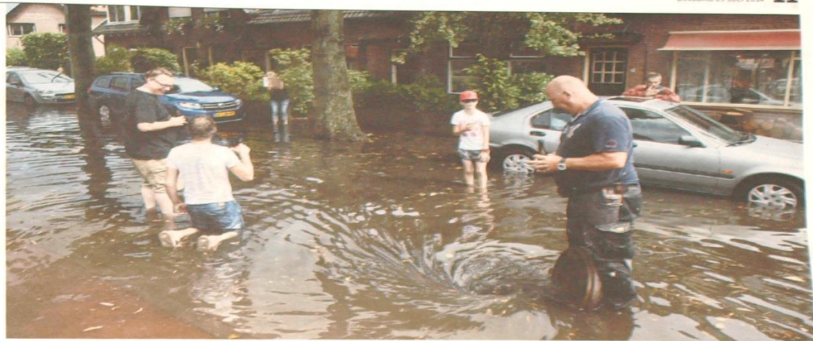
De Larenseweg in Hilversum, waar enkele bewoners een putdeksel hadden gelicht. Dat hielp weinig, dan maar een plasje.

Het noodweer liet geen groeivaktes in Nederland ongemoeid, op Drenthe en Groningen na. In zes uur tijd viel er in de ochtend meer regen dan in de hele maand juli (65 tot 95 millimeter), meldde weerbedrijfs MeteoGroup. Noord-Holland, Zuid-Holland en Brabant spanden de kroon met een hoeveelheid neerslag tot 130 millimeter. Dat zijn dertien emmers water per vierkante meter. Op vliegbasis Deelen viel met 131,3 millimeter neerslag de meeste regen. Ook Alphen aan den Rijn, Maarsse, Breukelen en Zaandam richting Beverwijk en Heemskerk kregen het te verduren. Het KNMI gaf code geel af: de code voor gevaarlijk weer. Later op de dag