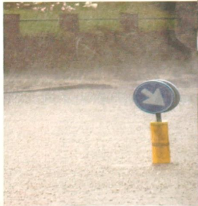
Een straat in Arnhem.