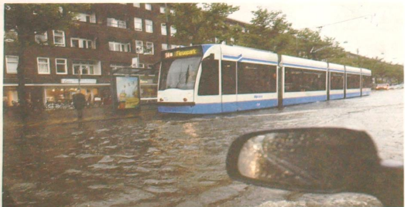
'Komt de 14 aangevaren', twitterde @Mokums. Amsterdam had veel overlast van de regen.

Weerzwaar België van Leter zegt op jaagte van een KNMI- en IPCC-rapport dat Nederland in de toekomst vaker met hevige regenval te maken krijgt door het veranderende klimaat. Om Nederlanders en daadwerkelijke kinderen van onderbreuk, krijg van verschillende factoren af. Denk aan infrastructuur, of het water snel genoeg weg kan, en cetera. Honderd millimeter in een paar uur kan in een weekend minder kwaad dan in een stad. Als je bijvoorbeeld veel bestrating hebt, kan dat water niet in de grond sipelen en wordt het toegewegeil aan wat al van de dakken en op de straten stroomt. De dreiging komt dus niet alleen van boven."