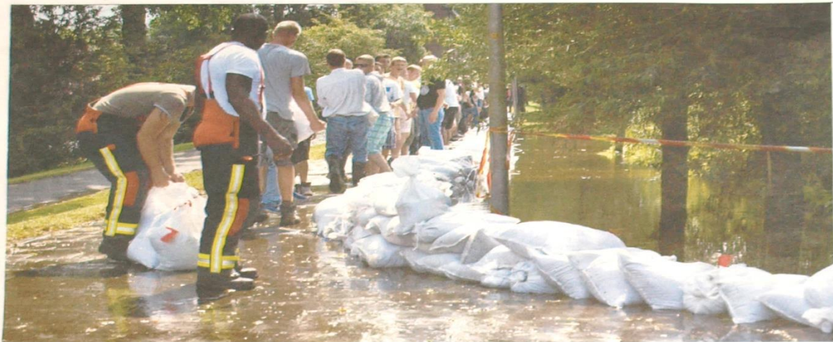
Een dijk in Alphen aan den Rijn stond gisteren op doorbreken door de hevige regenval. Bewoners helpen met het plaatsen van zandzakken.