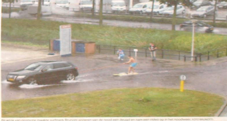
Bij wijze van promotie maakte surfmark Brno: gisteren van de nood een deugd en nam een video op in het noodweer.